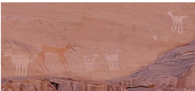
ANTELOPE HOUSE PICTOGRAPH - CANYON DE CHELLY

Como la pictografía, los petroglifos también son imágenes creadas para registrar diferentes tipos de información como historias, creencias y eventos específicos, pero a diferencia de la pictografía que usa pigmentos naturales, los petroglifos se hacen tallando o picando la superficie de una roca. Diferentes tipos de herramientas se usaban para crear estas imágenes y aunque también se han ido borrando con el paso del tiempo, muchas siguen visibles, haciendo posible que los arqueólogos puedan estudiarlas hoy en día. Los arqueólogos también trabajan para preservar la pictografía y los petroglifos y para protegerla del vandalismo.