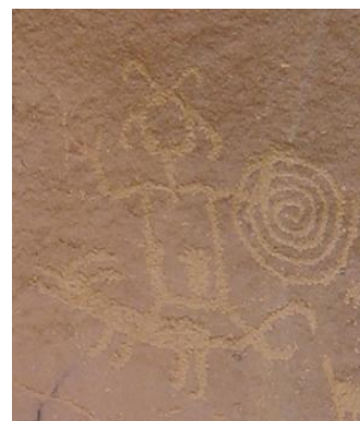
CHACO PETROGLYPH KOLK, MELINDA. CHACOPETROGLYPH1.JPG . 1-OCT. PICS4LEARNING. 7 MAY 2021